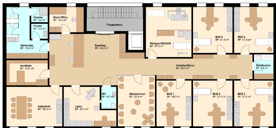
Grundriss OG (Ärztzentrum)

Hausarzt-Stellenprozentage: total 150-200